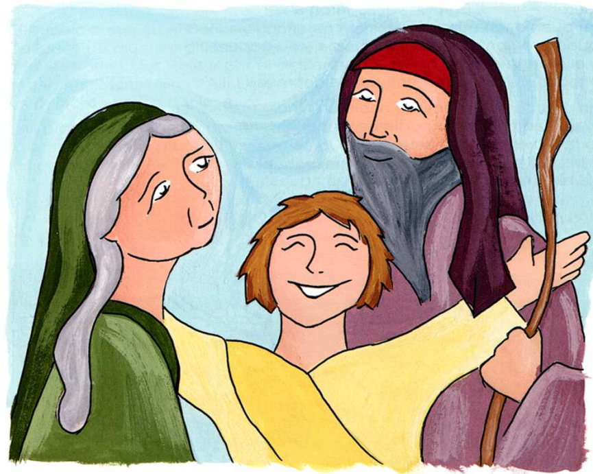
De la descendencia de Abraham nacerá Jesús, el Salvador.

Según la promesa de Dios, Sara y Abraham, en su vejez, tuvieron un hijo, Isaac, que quiere decir «Dios sonrío».